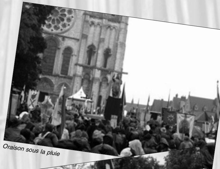
Oraison sous la pluie

Bien chers pèlerins, vous êtes l'espoir de l'Eglise, vous êtes la Tradition catholique en marche, la Tradition éternelle de l'Eglise.