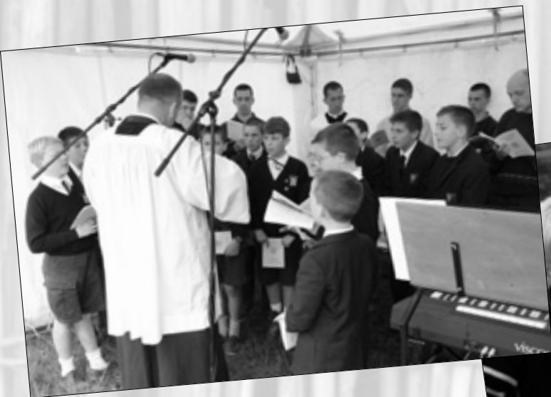
A cœur joie!