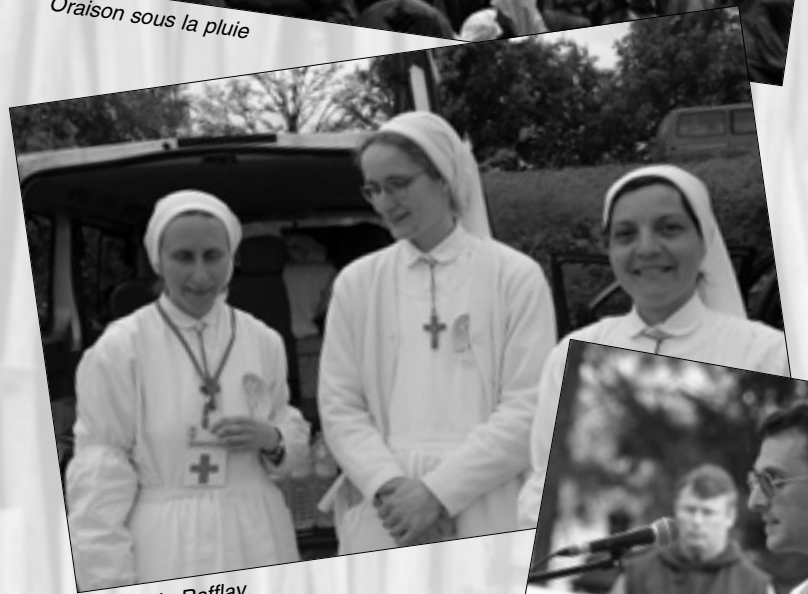
Sœurs du Rafflay