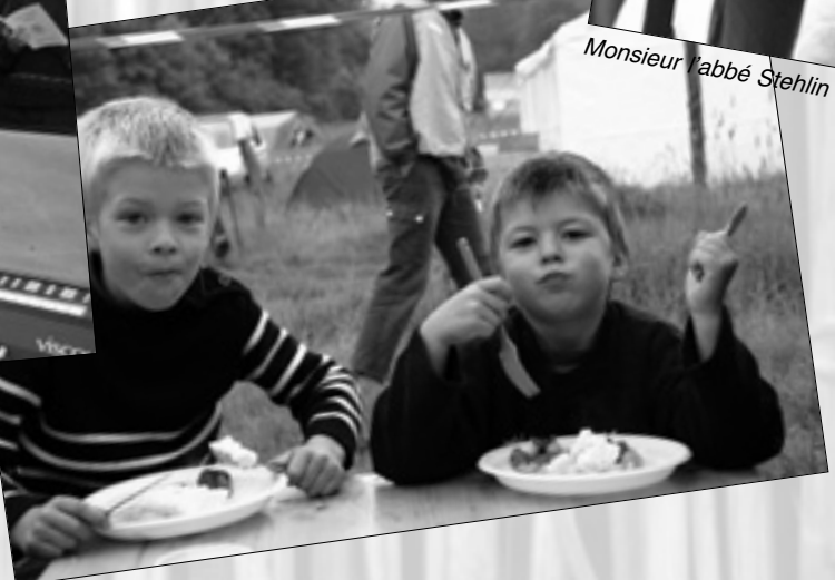
La jeune classe