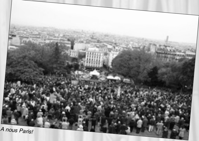
A nous Paris!